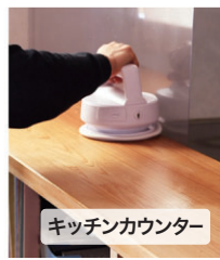
キッチンカウンター